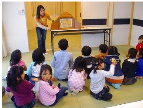
地域文庫での読み聞かせ