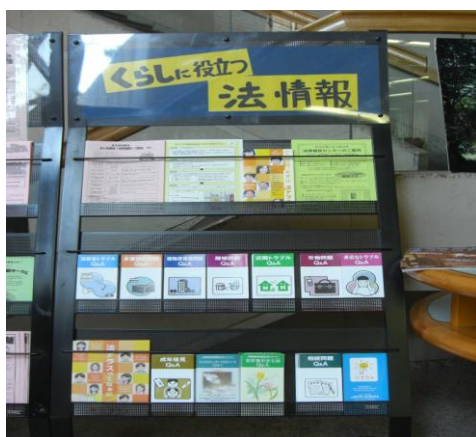
大井図書館の法情報パンフレットコーナー

上福岡・大井両図書館では、暮らしに役立つ法律関係のパンフレットを集めた法情報パンフレットコーナーを設置し、また、上福岡図書館では、就職・起業・経営関係の資料を集めたビジネス支援コーナーを設置しており、生活課題に合わせた資料提供の充実に努めています。ビジネス支援コーナーの資料は、土日にまとめて貸し出されることが多く、就職や起業・転職などに役立っています。またテーマ展示やミニ展示によって資料の積極的提供を行っており、展示することによって貸出しにつながっています。資料費が縮減傾向のなかで、こうした既存の資料を活用したサービスをさらに充実していく必要があります。