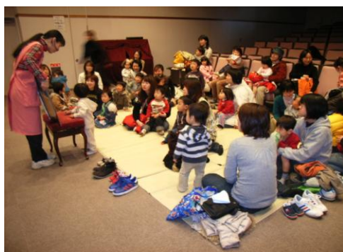
上福岡図書館のおはなし会

大井図書館では、地域文庫による身近できめ細かい児童サービスを提供しており、読み聞かせボランティアの育成やボランティアとの連携事業も実施しており、地域に密着した児童サービスを実現しています。しかし、上福岡図書館と比べティーンエイジ向けの資料は少なく、十分なヤングアダルトサービスが展開されていません。