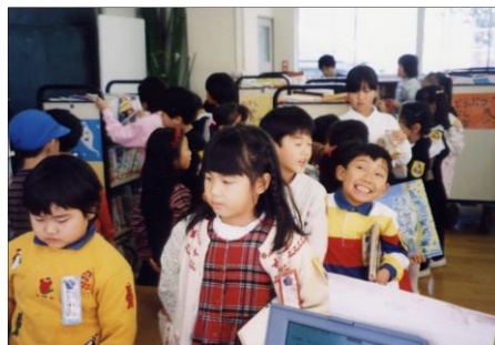
移動図書館の巡回貸出し