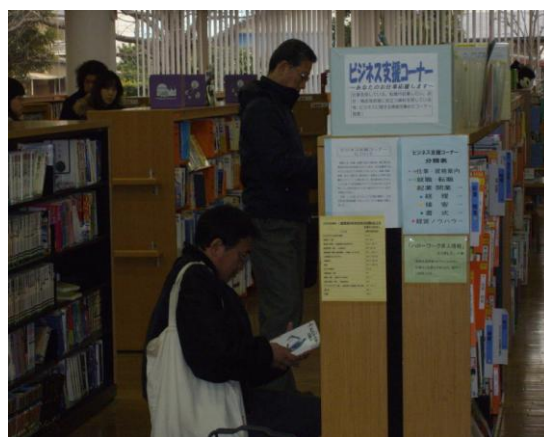
上福岡図書館のビジネス支援コーナー