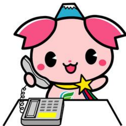
ふじみ野市 PR 大使「ふじみん」

ご利用の際には、3日前までに上福岡図書館・大井 図書館へ電話などでご予約ください。