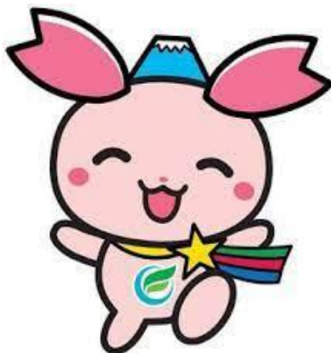
ふじみ野市 PR 大使「ふじみん」